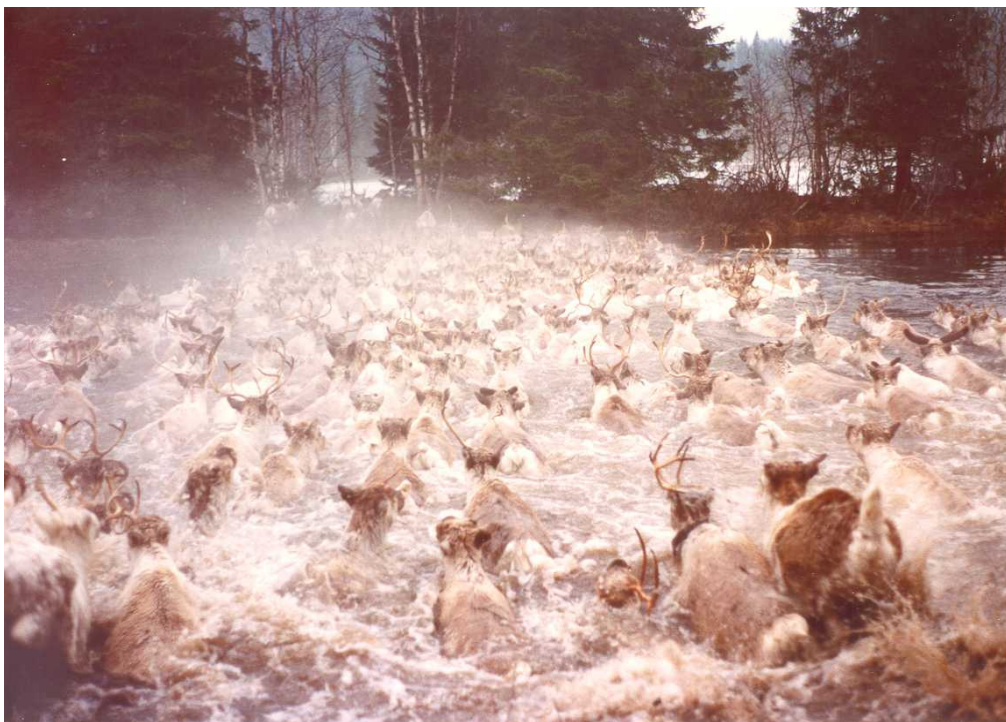
Svømmende hjortevilt kan ikke jages og avlives med mindre den forfølges som såret.

Svømmende hjortevilt må ikke jages eller avlives med mindre det forfølges som såret, jfr. Viltl. § 22.