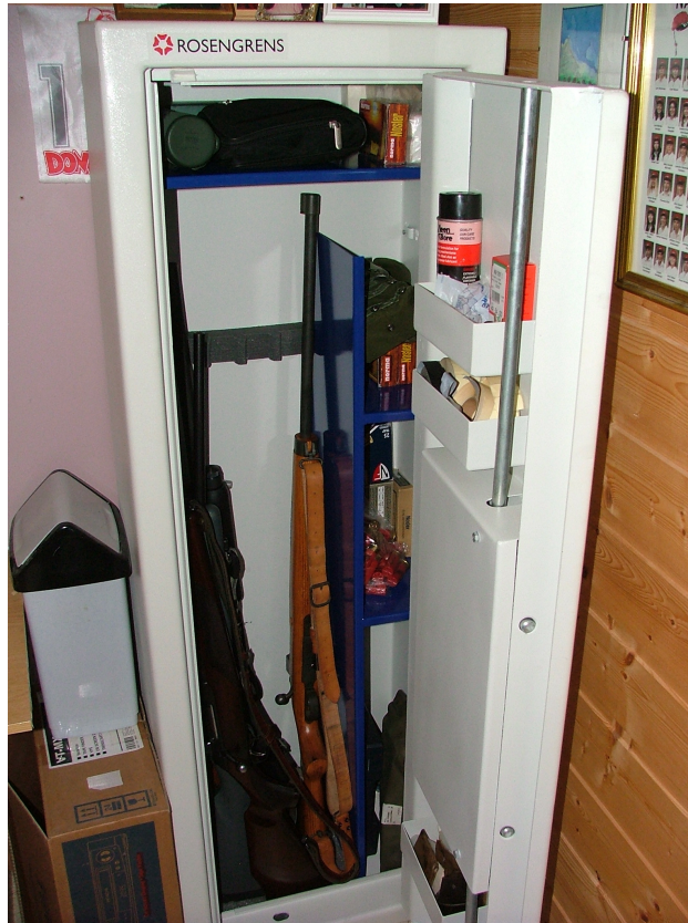
Alle registreringspliktige våpen eller en vital del av våpenet skal oppbevares i FG-godkjent sikkerhetsskap eller i skap med høyere sikkerhetsnivå.

Dersom skapene suppleres med lodd på innsiden, slik at egenvekten overstiger 150 kg, er det ikke krav om forankring av skapet.