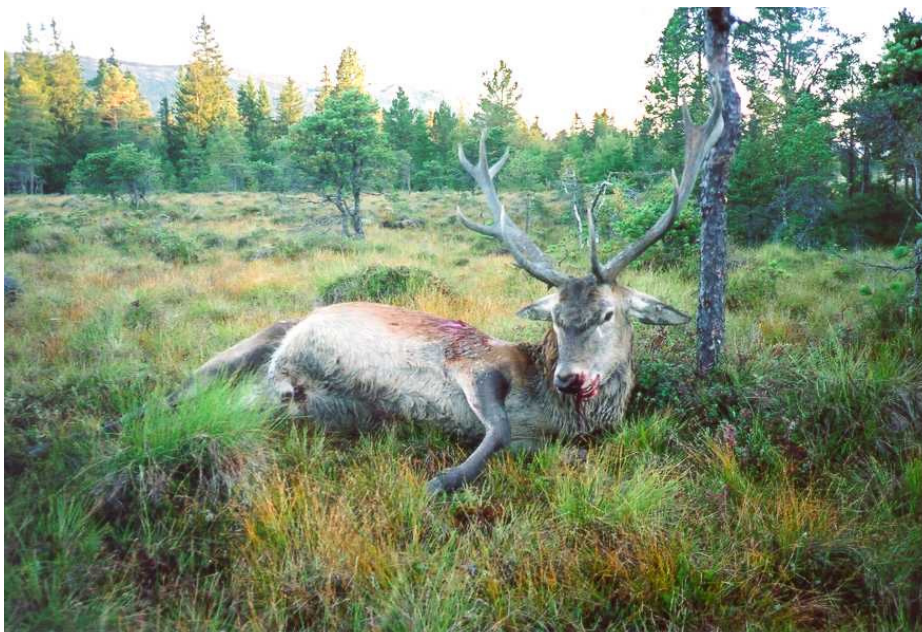
Den som under jakt sårer elg, hjort og rådyr, plikter å gjøre det en kan for å få avlivet dyret snarest mulig.

Dersom kassasjonen skyldes feil behandling av dyret fra jegeren/jaktlagets side, skal det tas på ordinære kvote.